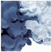
TABLEAU DE FLUX DE TRÉSORERIE CONSOLIDÉ